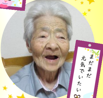
まだまだ 元気でいたい