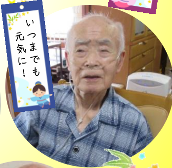
いつまでも 元気に!