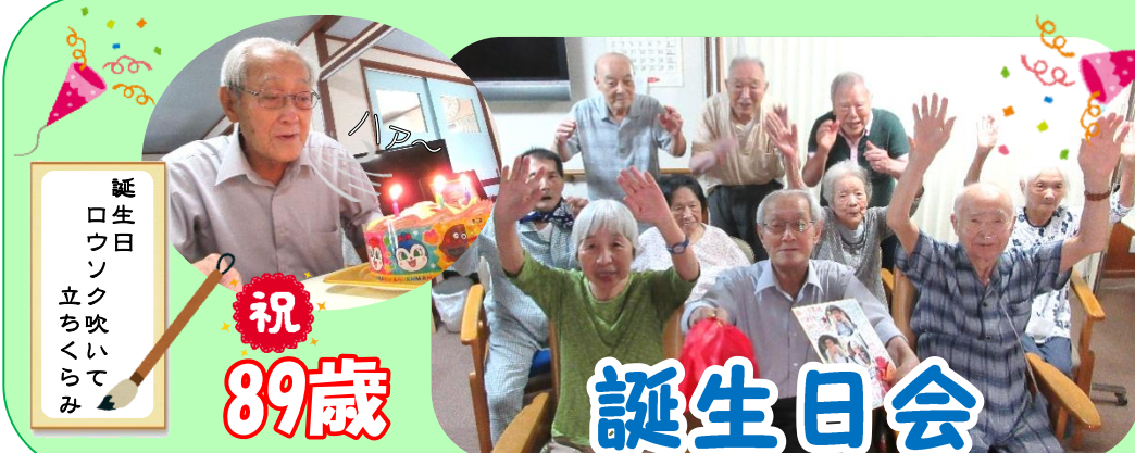
誕生日 ロウソクの数 立ちく らみ