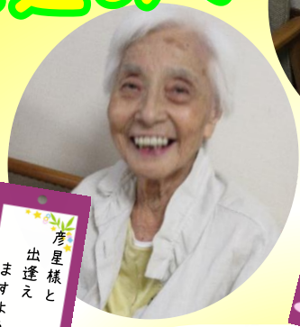
彦屋様と 出逢え ますように