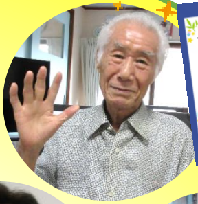
織姫さまに 会えますように