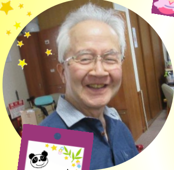
上野のパンダが 早く大きく なりますように