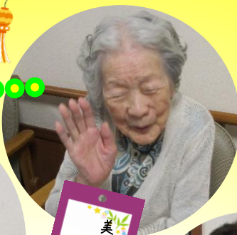
美しさを保て 年をとりつに