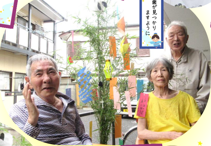
入歯が見つかり ますように