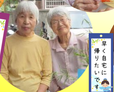
早く自宅に 帰りたいです