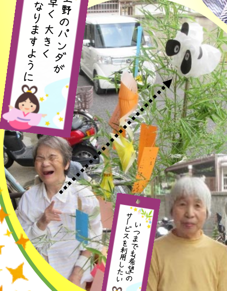
少しでも希望の サービスを利用したい