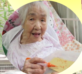
美味しい物を たくさん 食べたい